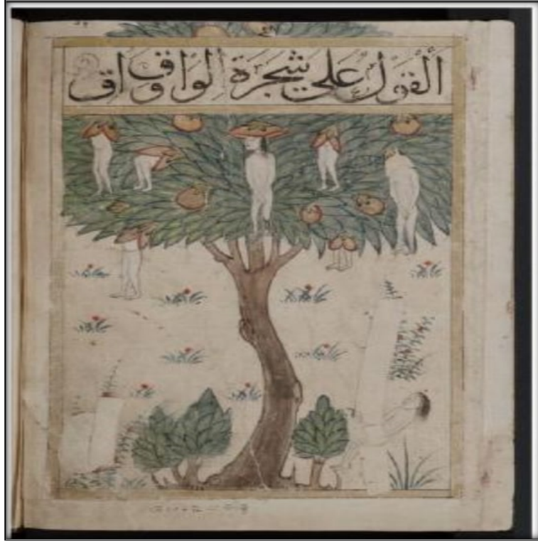
Şeceretü'l-vak vak (Vak Vak Ağacı), Ebü'l-Ferec, Isfahâni. Kitabül Bulhan Bodleian Library MS. Bodl. Or. 133. S. 2.