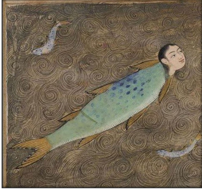
Deniz kızı, Kazvini, Ajaib'ul mahhlukat ve Garayib'ul mevcudet Princeton Libary, Garrett n. 82G.