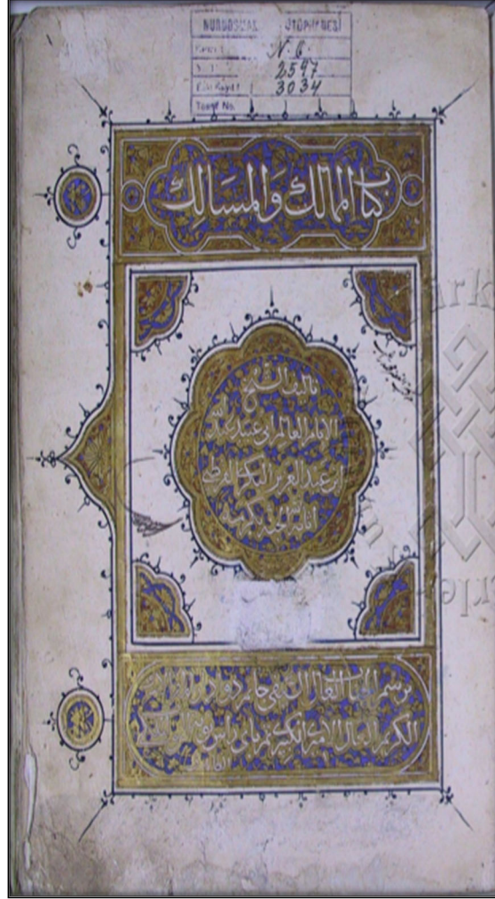
Bekri. Mesâlik ve'l-memâlik, Nuruosmaniye N, 3034, İstanbul. S. 1.