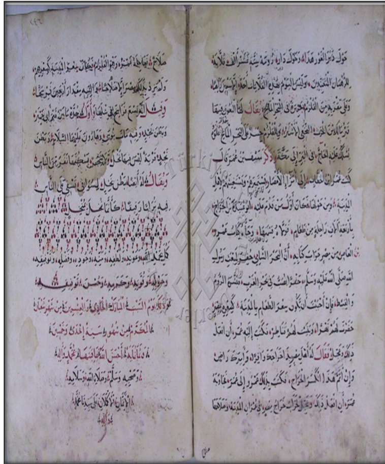
Bekri. Mesâlik ve'l-memâlik, Nurosmaniye, İstanbul. Son sayfası.