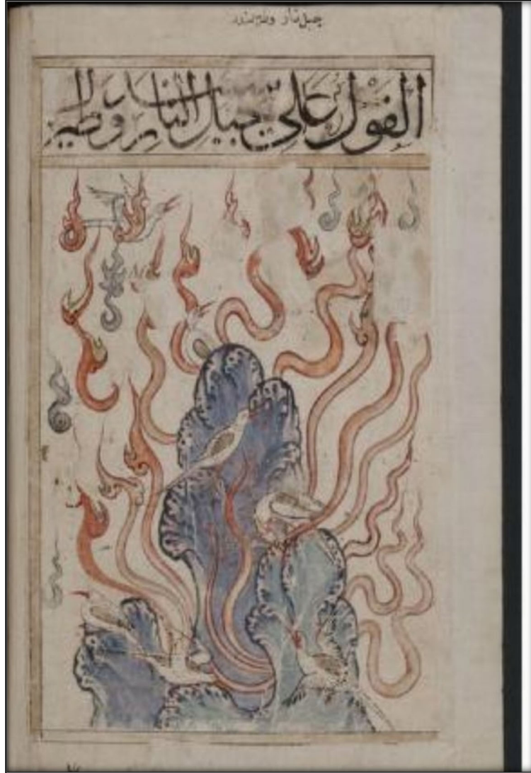
Ateş Dağı, Ebü'l-Ferec, Isfahâni. Kitabül Bulhan Bodleian Library MS. Bodl. Or. 133. S. 4.