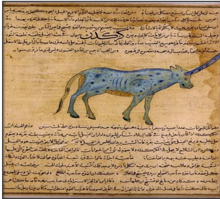
Gergedan resmi, Kazvini, Ajaib'ul mahhlukat ve Garayib'ul mevcudet, Princeton Library, Garrett n. 82G.