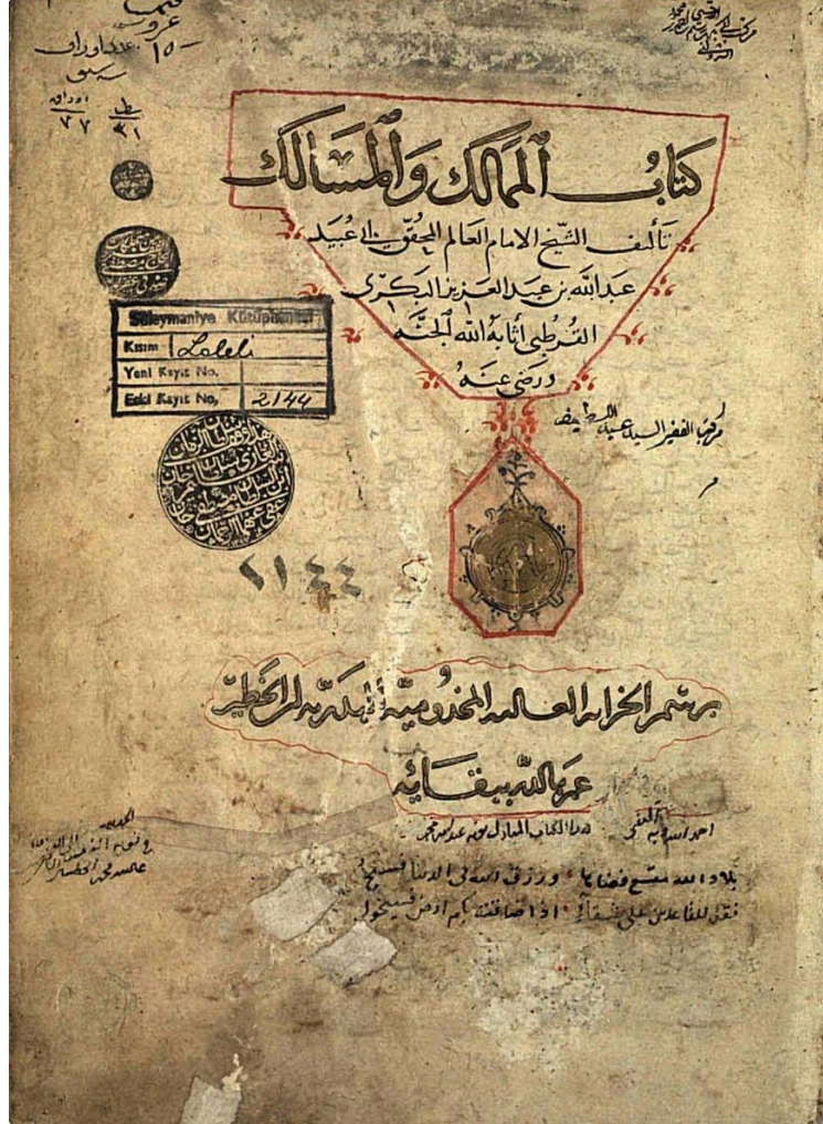
Bekri'nin kullandığımız nüshası